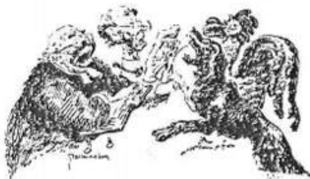
Prästen och hunn tjäna föa må munn, klockarn och hanen Ha samme varen.