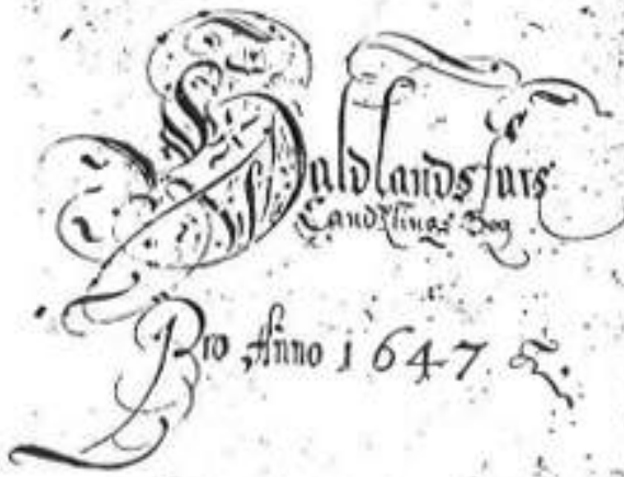
Dombokens försättsblad med titel, vuri ingår den älderdömligh formen Haldlandstar (= hullänning).